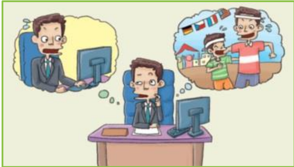
[변호사 vs 아버지]