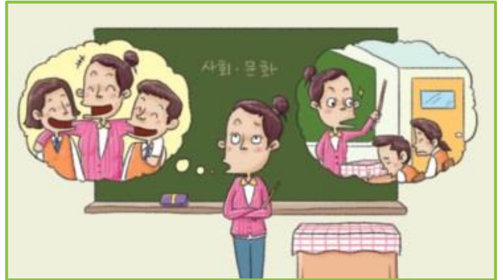
[친구 같은 선생님 vs 단호한 선생님]